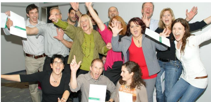
Die Zertifikate der Lernwerkstatt Olten sind auf dem Arbeitsmarkt bekannt und angesehen.