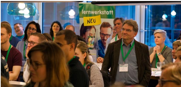
Inspirationen für Führung, Coaching und Mentoring am jährlichen Coaching-Mentoring-Event. www.coaching-mentoring-event.ch

Zertifikat «Ressourcenorientiertes Coaching» der Lernwerkstatt Olten