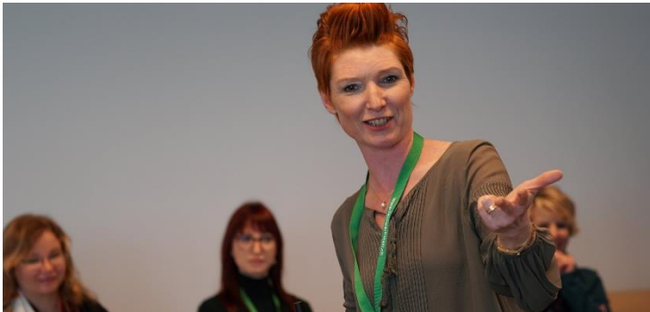
Die Weiterbildungen leben von einem hohen Praxisbezug.